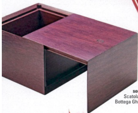
Magiche sorprese. Scatola in legno, di Bottega Ghianda.