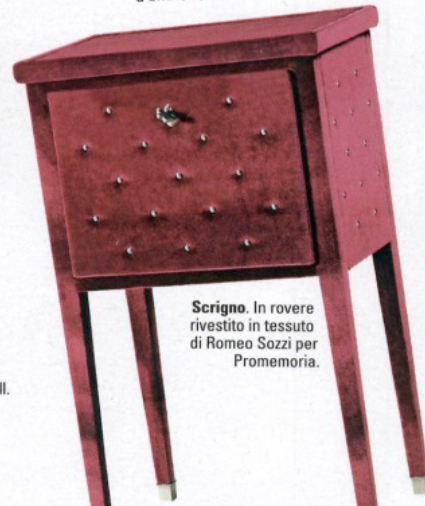
Scrigno. In rovere rivestito in tessuto di Romeo Sozzi per Promemoria.