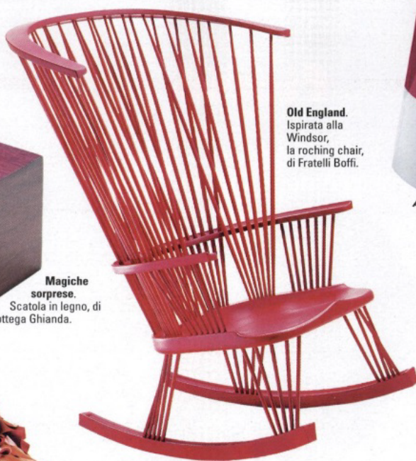
Old England. Ispirata alla Windsor, la rocking chair, di Fratelli Boffi.