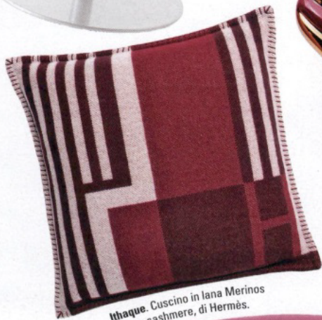
Ithaque. Cuscino in lana Merinos e cashmere, di Hermès.