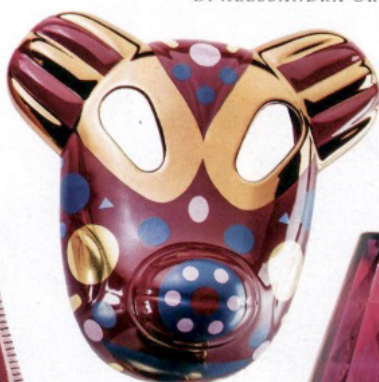
In maschera. Baila collection firmata da Jaime Hayon per Bosa.