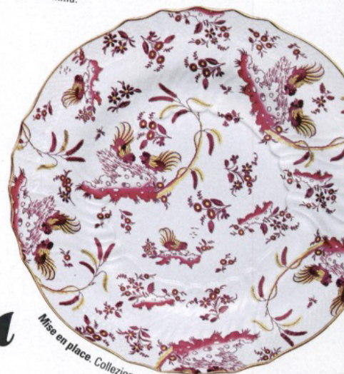
Mise en place. Collezione Ginori 1735 Oro di Doccia.