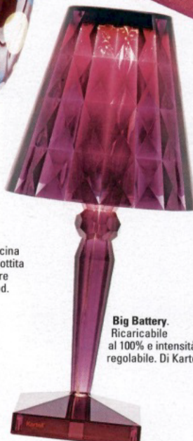
Big Battery. Ricaricabile al 100% e intensità regolabile. Di Kartell.