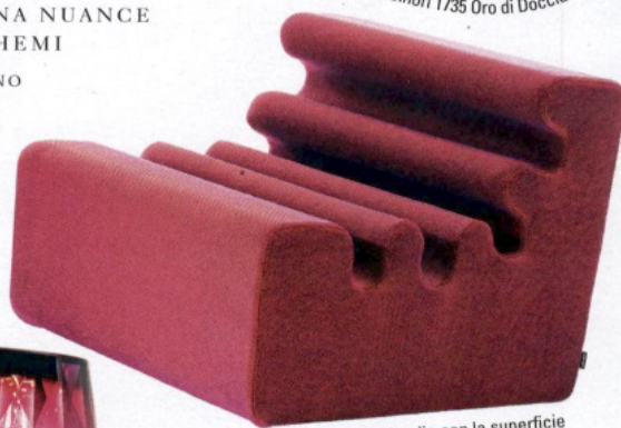
Icona Pop. Karelia con la superficie a onde, by Lisi Beckmann per Zanotta.