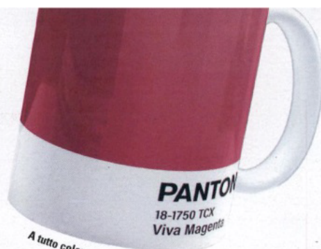
A tutto colore. Tazza Pantone 2023 di Moroni Gomma.