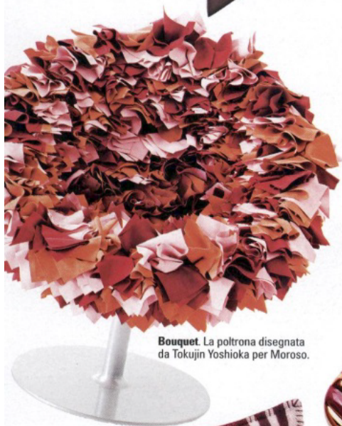
Bouquet. La poltrona disegnata da Tokujin Yoshioka per Moroso.