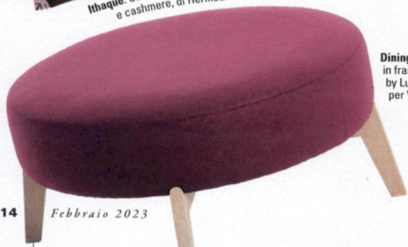
Dining. Poltroncina in frassino imbottita by Lucidipevere per Very Wood.